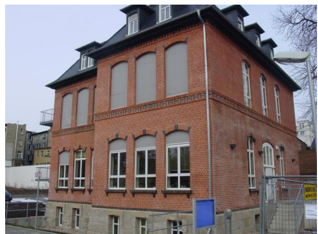
Jena 2006: de school in gebruik als Volksuniversiteit

Zeggen wat je doet, doen wat je zegt en wat je doet steeds beter proberen te doen: dat is waar het om gaat als we ons richten op het vasthouden of verbeteren van de kwaliteit van ons onderwijs.