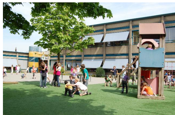
OJBS De Keg

De ouders kiezen onze school vanwege het jenaplanconcept en/of de openbare identiteit en/of vanwege het feit dat we ons onderwijs geven binnen een continuïteit. In een persoonlijk gesprek zal echter altijd aan de ouders gevraagd worden om de uitgangspunten van De Keg te onderschrijven, alvorens zij een definitieve keuze maken.